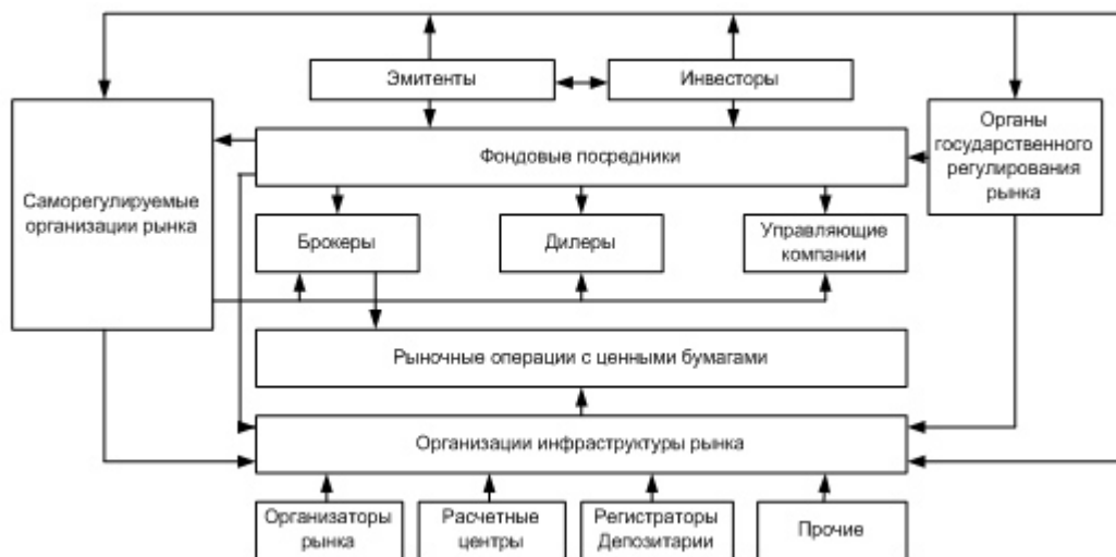
Рис. 1. Операции на рынке ценных бумаг